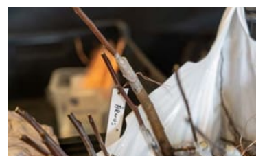
Färdigt ympade plantor läggs i plastpåse och förvaras i kylskåp. Där får de vila i svalka och mörker innan plantering.