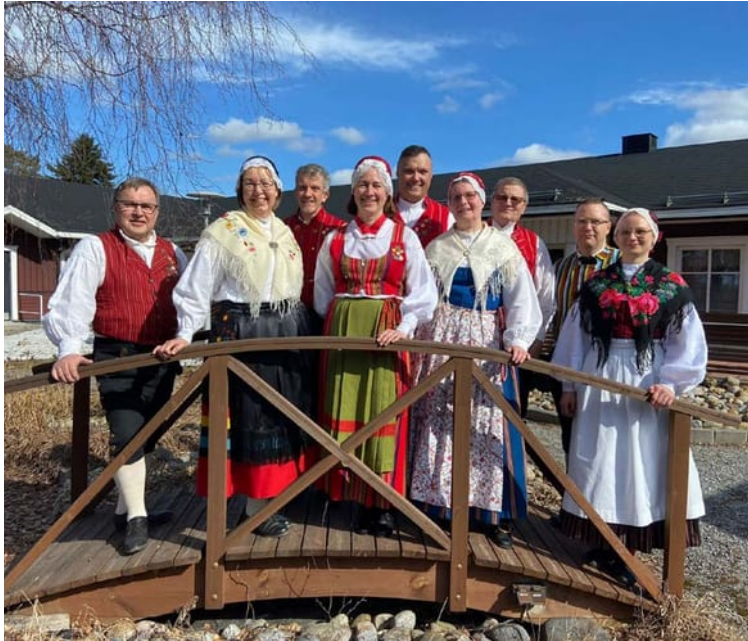
Efter upprådande på Marielund.

Under lördagen den 13 juni erbjuds flera intressanta workshoppar på Norrvalla.