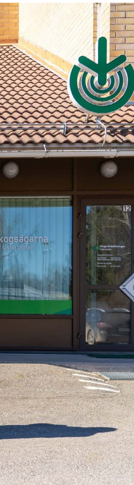
osoitteessa Vöyrintie 12.