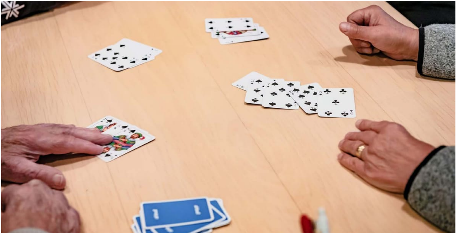
Pidrokvällar ordnas både i Komossa och i Djupsund. Arkivbild.

19.5 FOLKHÄLSANS FAMILJECAFÉ: kl. 10-12 i Vörå uf:s lokal, Mini UF, Bergby-