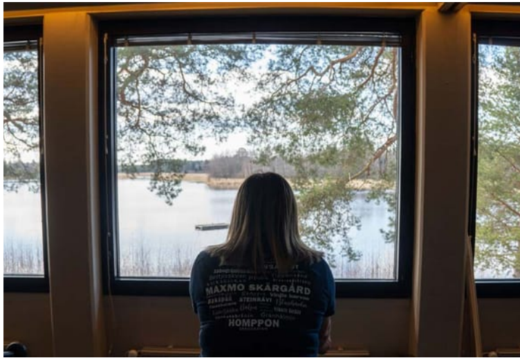
Utsikten från gymmet är inte fy skam.