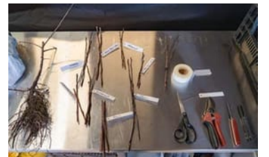
Det här behövs för att ympa äppelträd: rotstam, ympar, ympkniv, tejp, sax, märkning, sekatör och vax.