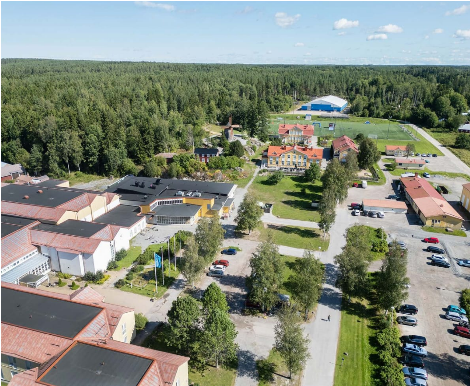
Finlands svenska biblioteks dagar ordnas den 21–22 maj på Norrvalla i Vörrå.