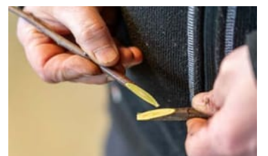
Rotstam och ympkvist före sammanfogning. Snitten måste vara precisa så det krävs en hel del övning för att få till tekniken.