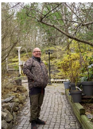
Snart blommar det i trädgården på nytt.

Han arbetar målmedvetet med att bevara och utveckla en omfattande äppelsamling, samtidigt som han utforskar nya odlingsmetoder.