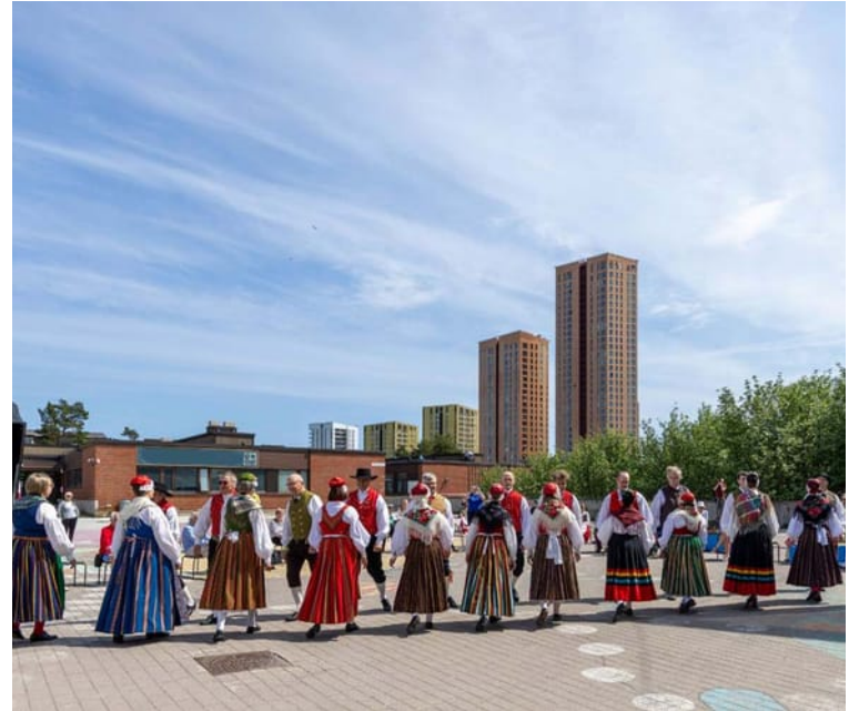
Menuett i Nordsjö.

Se hela stämmoprogrammet på https://folkdans.fi/folkdansstamman-2026/ för exakta tider.