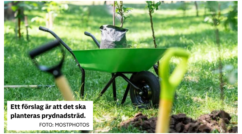
Ett förslag är att det ska planteras prydnadsträd.