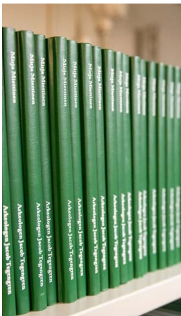
Vöråbygdens lokalhistoriska arkiv är ett utskott till Jacob Tegengren-sällskapet.