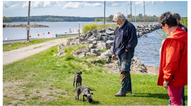
Oravais bätklubb vuokraa aluetta osakaskunnalta. Satamaa ei käytetä pelkästään virkistys- ja matkailutarkoituksiin. Myös Pelastuslaitoksella on täällä kaksi venettä, pelastusvene ja öljyntorjuntavene.