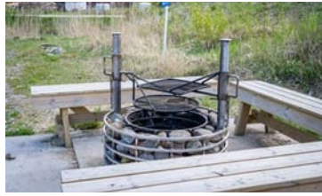
Viime vuonna rakennettiin grillauspaikka yhdessä kalastusseuran kanssa.

Laiturilla on Oravais simsällskapin käyttämä avantosauna. Sataman yhteydessä on kesäisin auki oleva grilli ja alueen vieressä on ui-