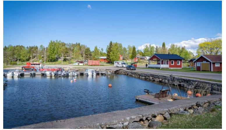
Kalastusseura järjestää vuosittaisen Hauenheitto-heittokalastuskilpailun Oravaisten satamassa 5. syyskuuta. Kalastusseura juhlistaa 80. juhlavuotiaan ja kilpailu järjestetään 30. kertaa.