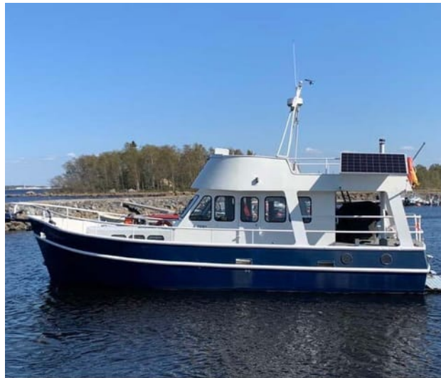
Ta båten i sommar.

Väl framme på Kummelskär finns klassisk laxsoppa, kaffe och hembakt till försäljning – och för den badsugna finns möjlighet