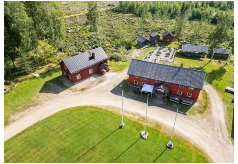
På Furirbostället i Oravais visas en utställning om Mårten Lassu.