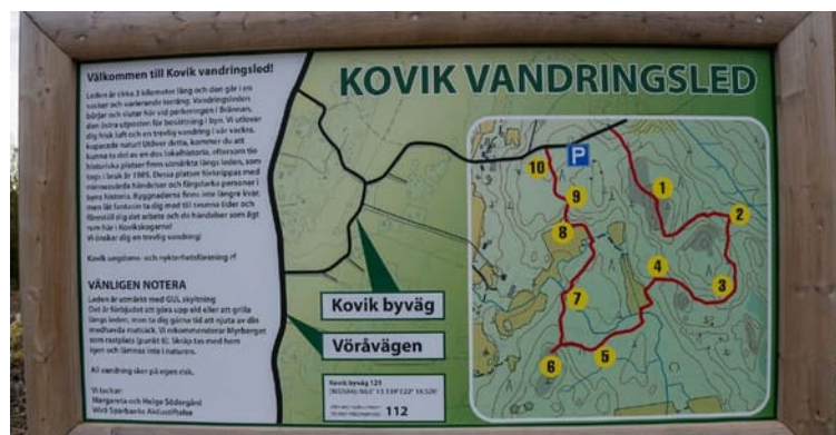
Stigen är ungefär tre kilometer lång. Alla tavlor längs vandringsleden har kunnat göras tack vare ett bidrag från Vörå Sparbanks Aktiastiftelse.