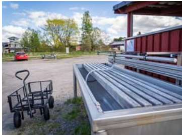
Mattvättbaljan vid Oravais hamn kom till på initiativ av Strandbyns byaråd. Efter tvätten kan mattorna köras vidare till torkställningen med kärra.

– Vi fick påla tio meter för att nå berget. Och ute i hamnen skulle jag tippa att det finns tjugo meter