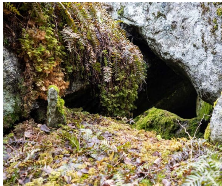
Vid Tjäänamåos steinin gömde sig byborna när ryssarna gick genom byn 1808.