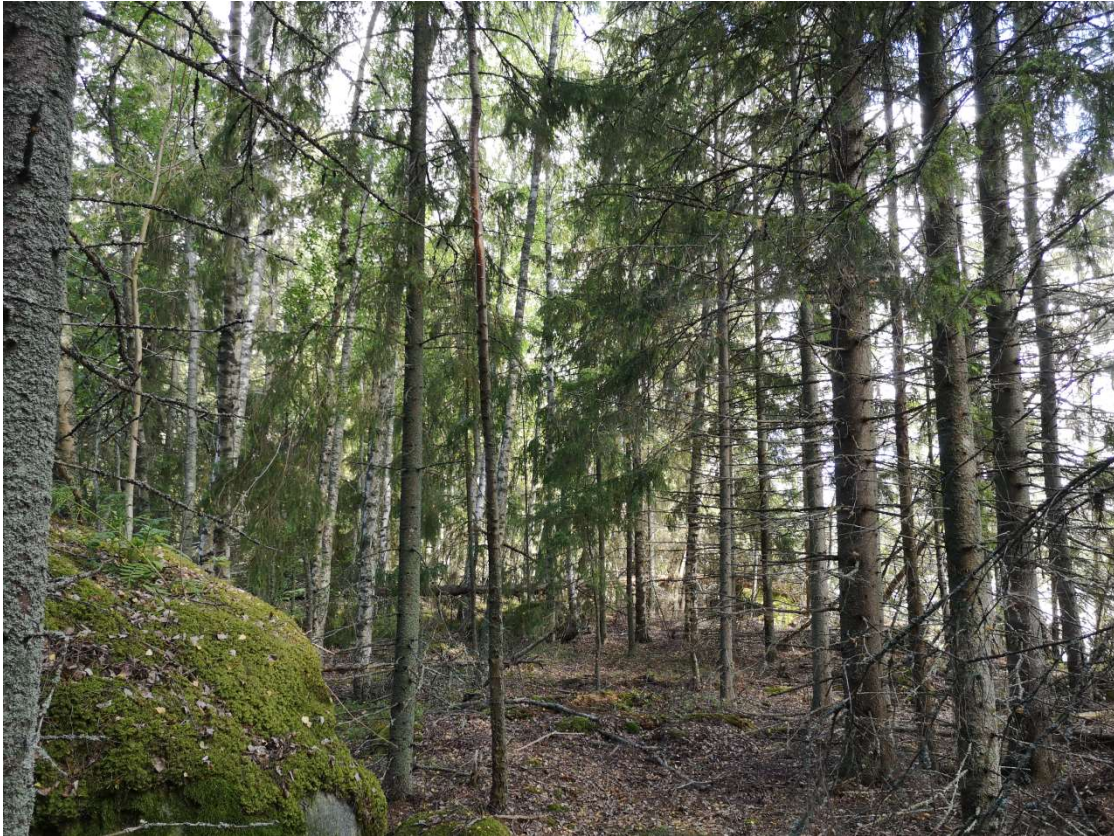
Bild 6. Vegetationen på område 5.