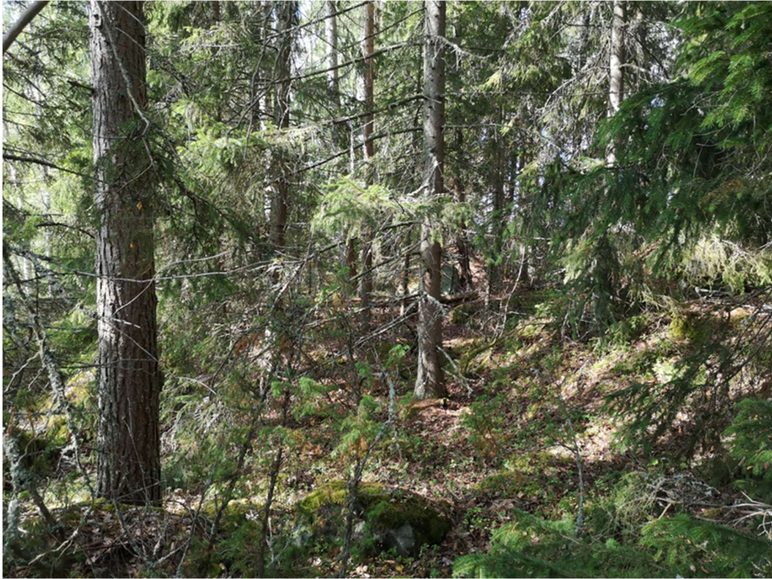
Bild 1. Vegetation i område 1.