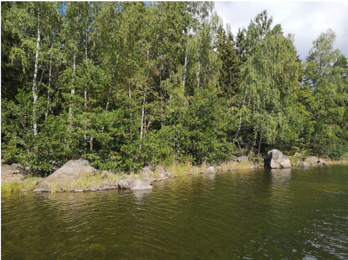
Bild 2. Smal stenstrand i område 1.