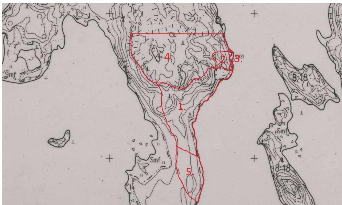
Karta 3. Vegetationsområdena 1-5 märkt på baskartan.