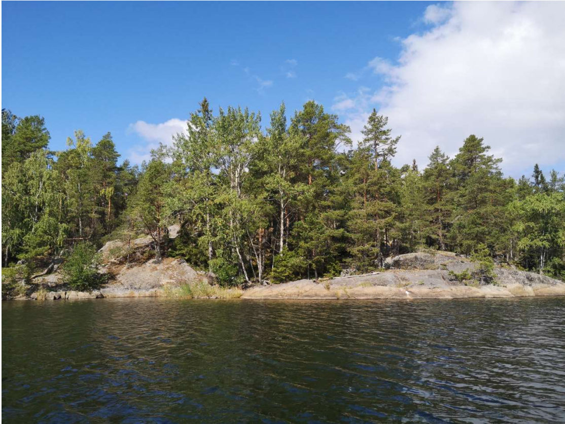
Bild 4. Havsklippa på område 3.