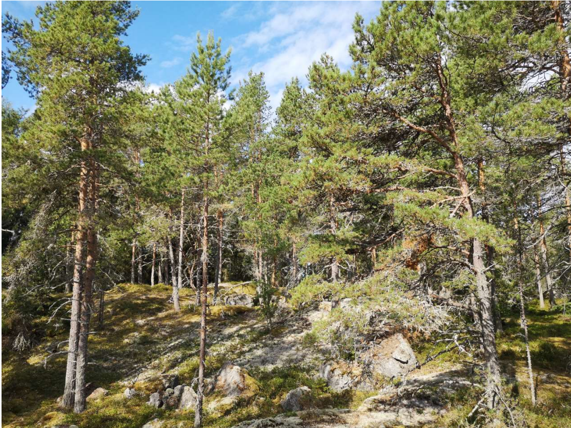
Bild 5. Bergig tämligen torr mo på område 4.