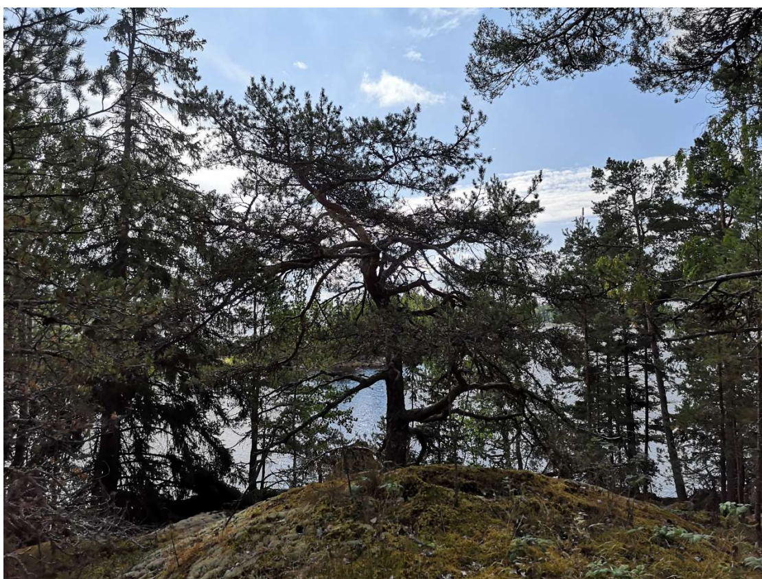
Bild 3. Gammal tall på område 2.

Område 2 tillhör de värdefulla livsmiljöerna enligt 10 § skogslagen, som en mindre produktiv karga moar vad gäller träproduktion, som kännetecknas av glest växande träd. Området skiljer sig ut från omgivningen på grund av sitt bergiga landskap och träslag. Träden är glesa och det växer även nödvuxna tallar på området ( bild 3 ).