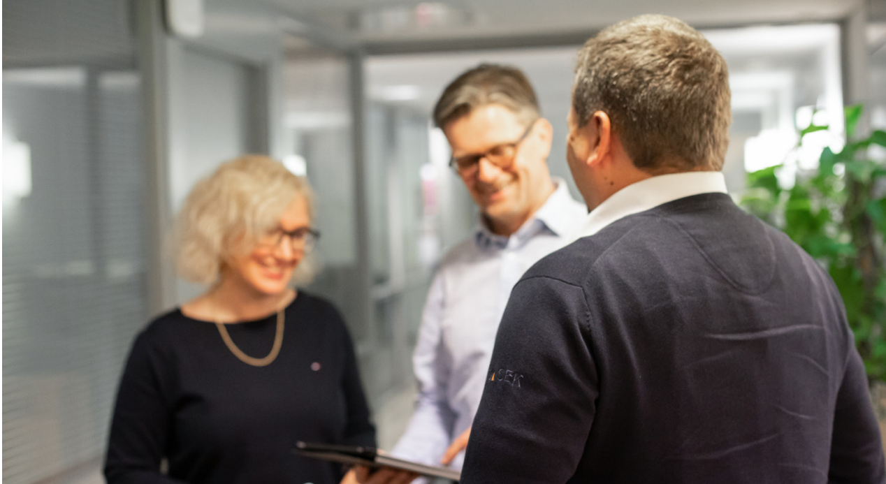
Företagsrådgivare på Startia och VASEK föreslår som ett alternativ för dem som planerar att starta eget att köpa ett företag som redan är verksamt.

Företagsrådgivare på Startia och VASEK föreslår som ett alternativ för dem som planerar att starta eget att köpa ett företag som redan är verksamt. Men även de som är intresserade av att köpa ett företag är ofta i kontakt med VASEK och frågar vilka typer av företag som är till salu. – Det finns serie-entreprenörer som ständigt letar efter nya affärsmöjligheter. Dessutom finns det företagare som letar efter andra