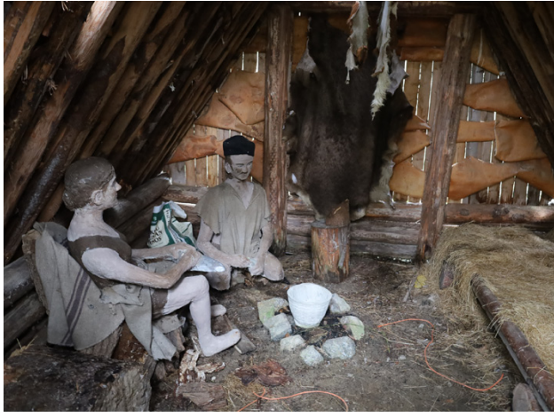
Så här ser det ut inne i grophuset.