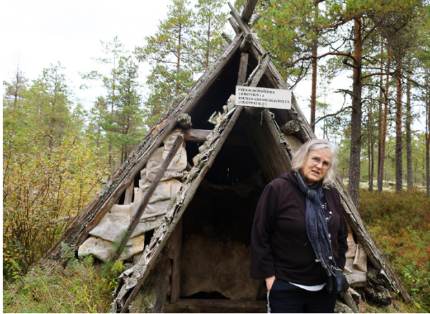
Det så kallade grophuset är till viss del nergrävt i marken.