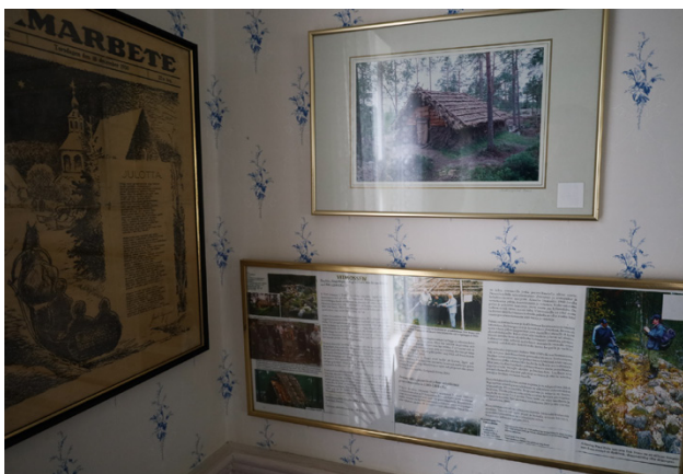
Tidningsutklippen visar hur det såg ut då Vitmossen byggdes.