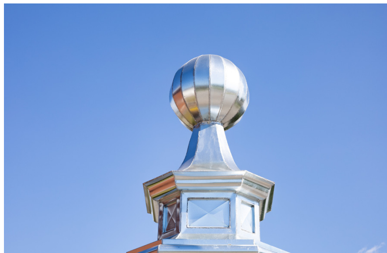
Kupolen är kronan på verket