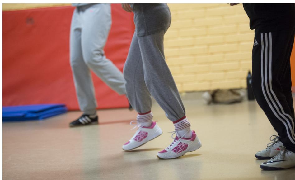
Rörelse och motion ingår i den planerade hobbyverksamheten.

Syftet med projektet är att det ska vara möjligt för varje barn och ung person att ha en avgiftsfri hobby som de tycker om. I Finlandsmodellen för hobbyverksamhet kombineras hörande av barn och unga om deras hobbyönskemål, samord-