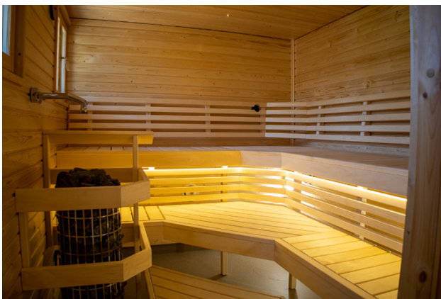
1500 talkotimmar har lagts ner på Herrgårdens bastur.