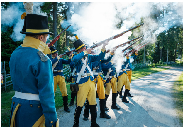
Svartkrut seglar upp i luften när soldaterna avfyra sina musköter.