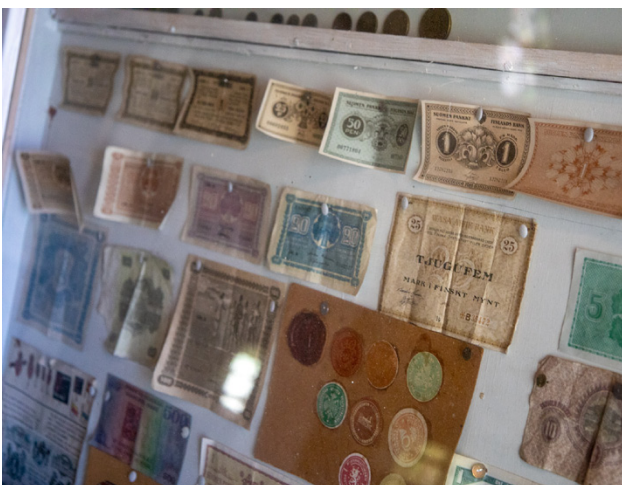
Även gamla sedlar finns i museet