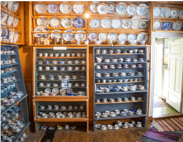
Porlinsinsamlingen är gedigen.