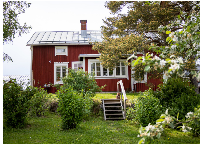
Det är högsäsong i Lillstugan.