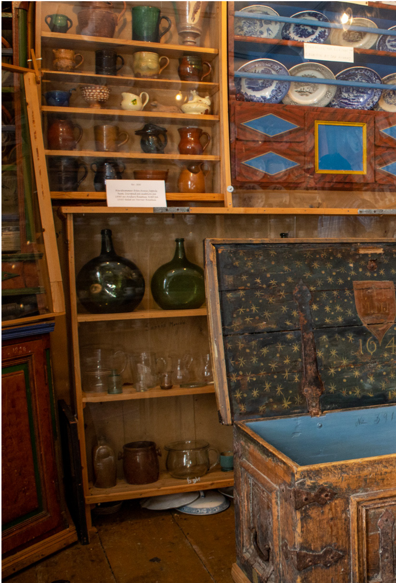
Kistan från 1600-talet sägs ha tillhört en av Sveriges kungar, berättar Börje Kyllkis.