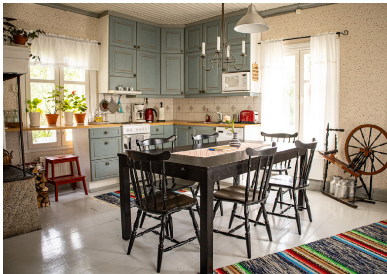
Gästerna tycker det är hemtrevligt och säger att Lillstugan väcker minnen till liv.