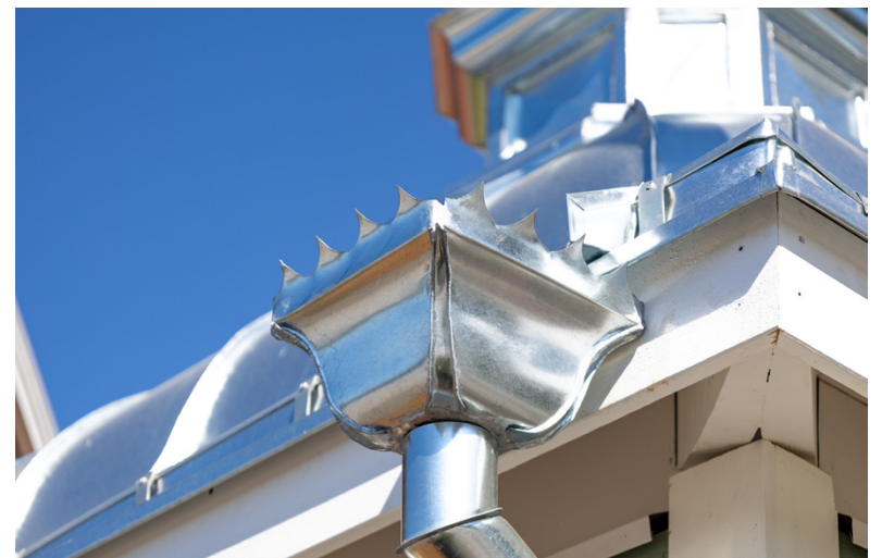
Stuprännorna är också inspirerade av medeltida slott.

jobba i kiosken. Kiosken är med reservation för dåligt öppen mellan 13–21, men väder.