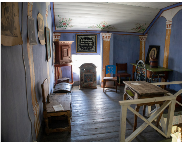
Alla föremål är noggrant kategoriserade.