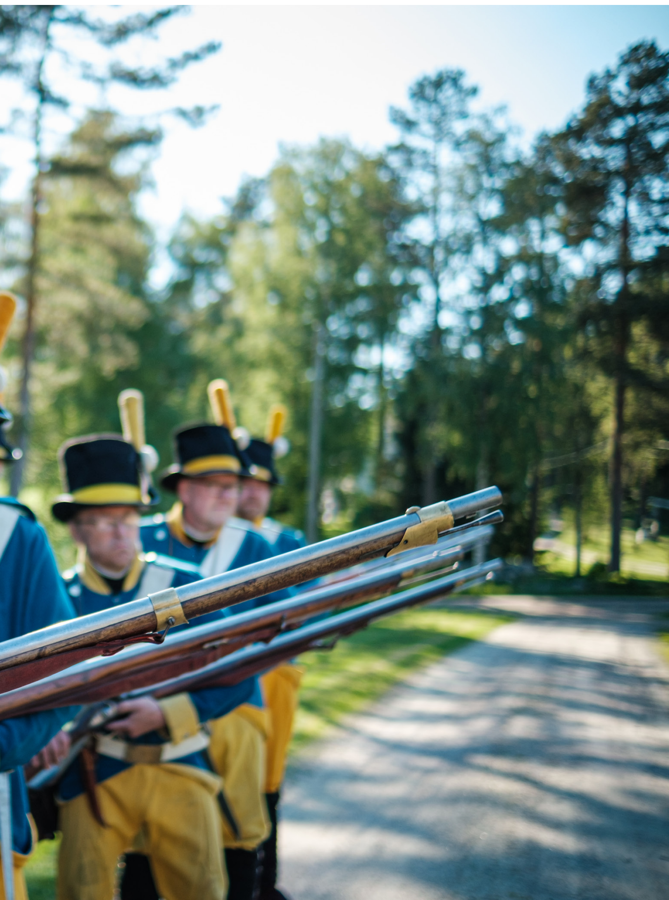
ementes Lif Compagnie.