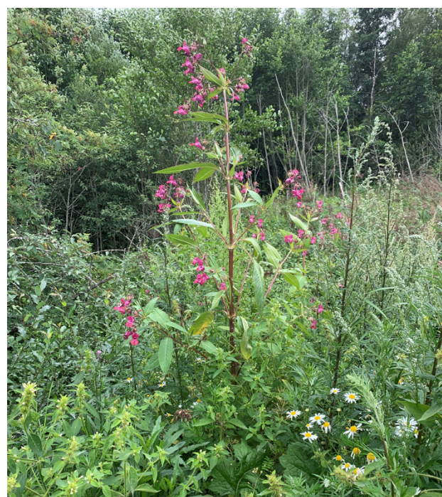
Jättebalsamin i Hellnäs.

Taloyhtiöiden omilla pihoilla osakkaita sekä omakotiasujia kannustetaan tor-