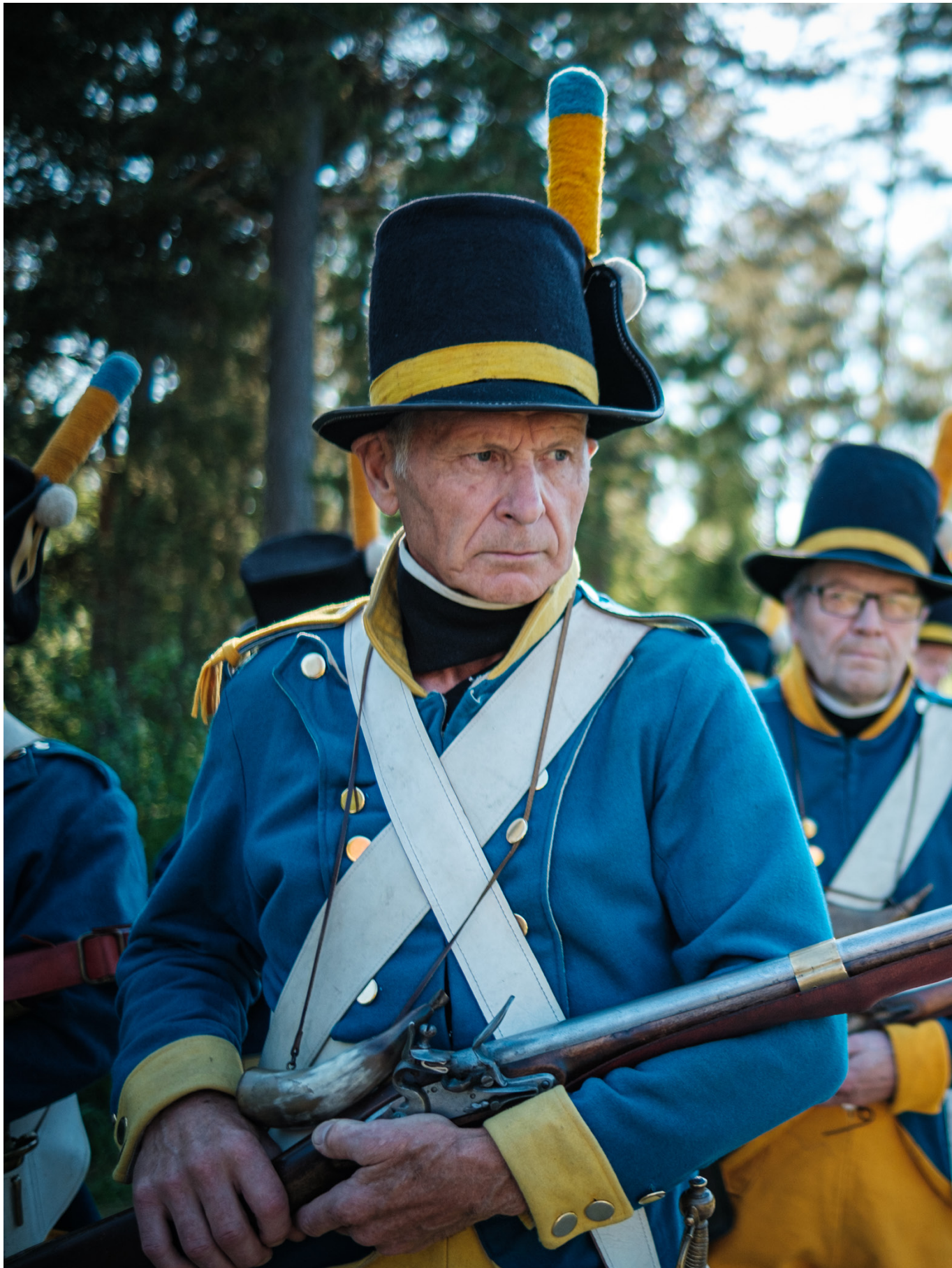
Truppen som är på väg att skjuta muskötsalut tillhör föreningen Oravais Historiska Förening och är en del av Kungliga Österbottens Reg