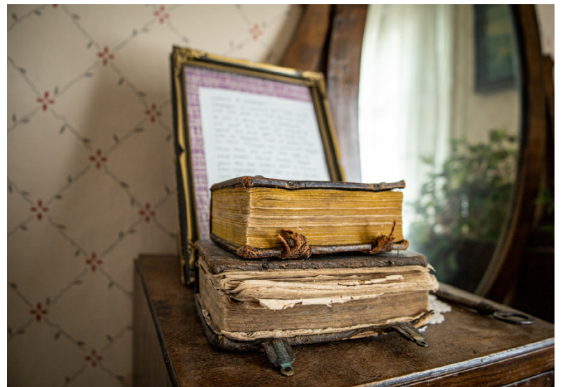
Paret Wikar har inrett med gamla föremål för att skapa stämning i stugan.