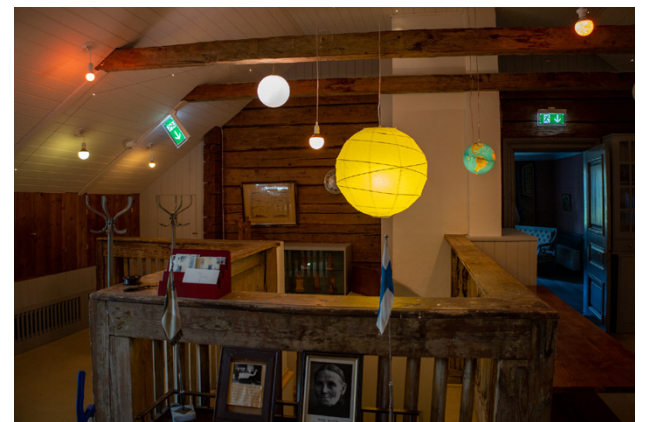
Trappan leder upp till tredje våningen där vita frun huserar.

– Hon finns nog kvar här i huset. Hon hade inget emot