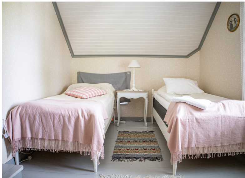
Paret har valt att lyfta fram husens anor och inrett med äldre möbler.