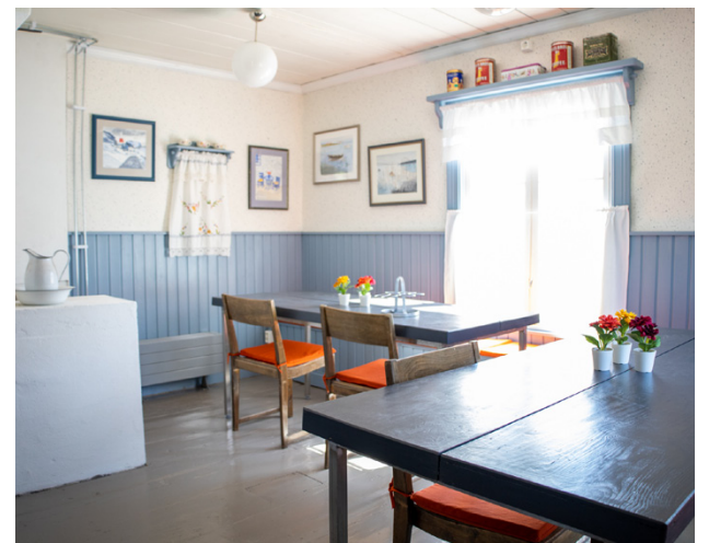
Lillstugan har förstörats med två bastur. Här är den ursprungliga delen av stugan. Hembygdsföreningen säger att den passar bra för mindre möten eller om man vill umgås en stund före eller efter bastubadet.