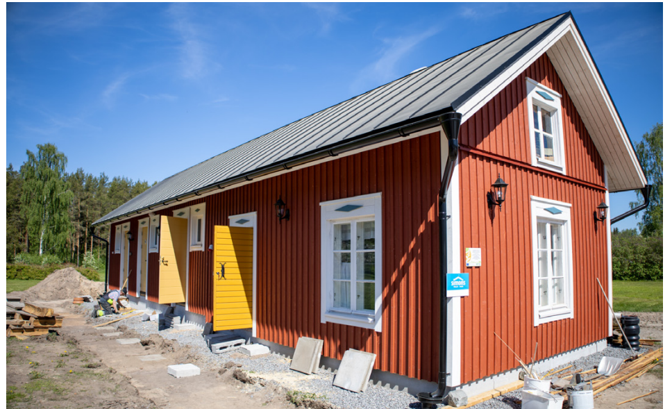
Lillstugan on saanut kaksi uutta saunaa.