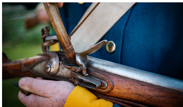
Musköterna laddas med lösa skott.