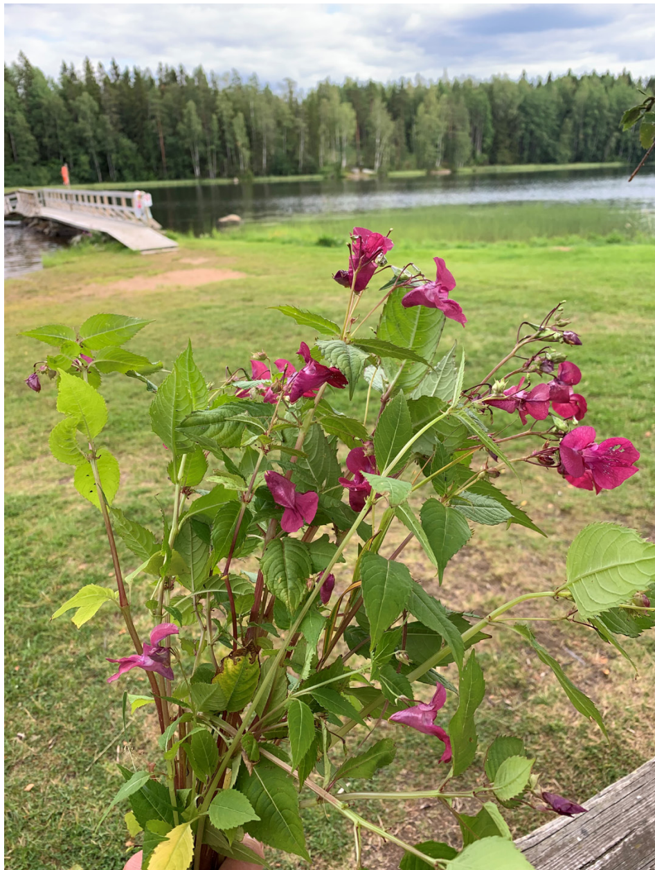
Jättebalsamin i Kalapää.

Hashtag #soolotalkoot #vieraslajit #kareliacbc #viekaslfie