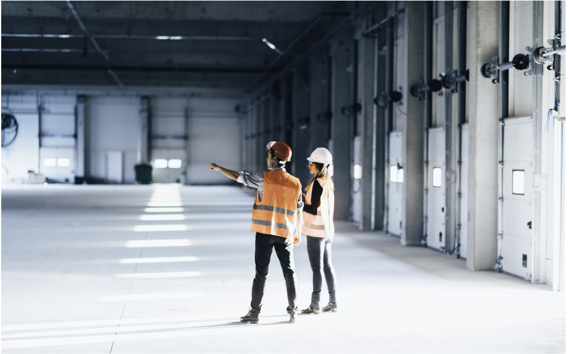
Lediga lokaler och tomter i Vasaregionen kan man hitta i på webbplatsen vasaregionenslokaler.fi